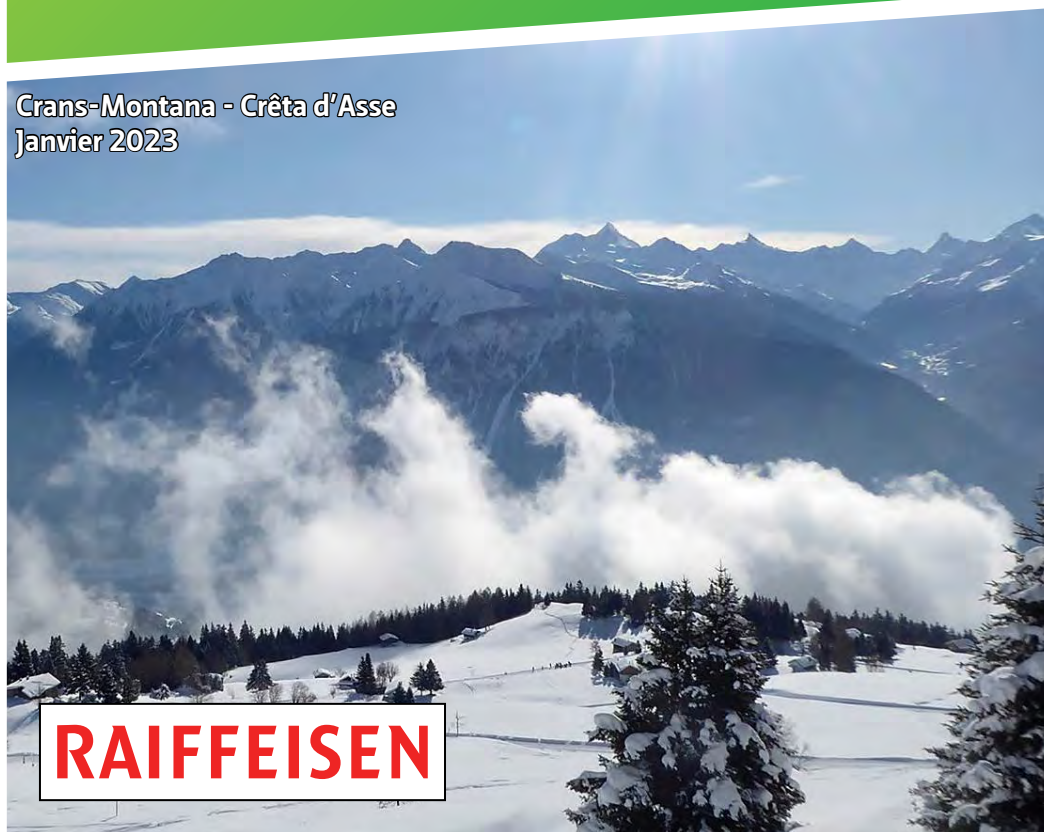
Crans-Montana - Crêta d'Asse Janvier 2023