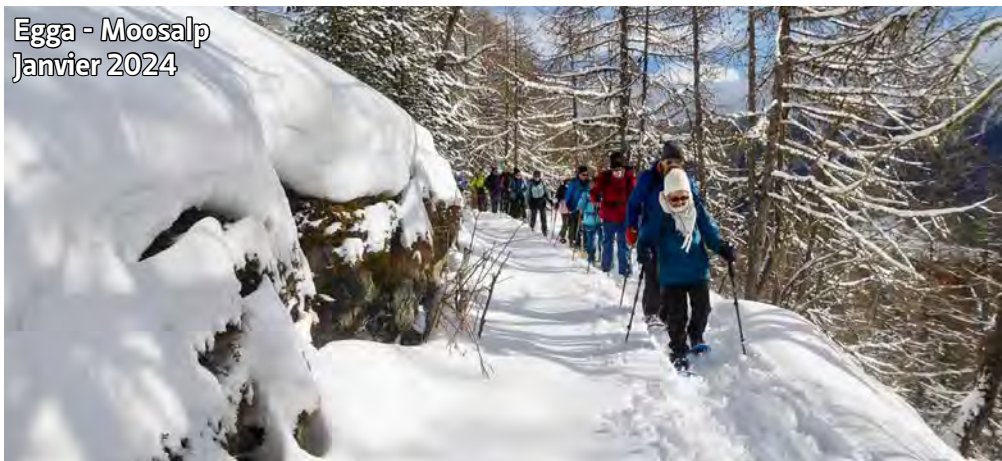
Egga - Moosalp Janvier 2024

Fin de la saison raquettes jeudi 20 mars 2025