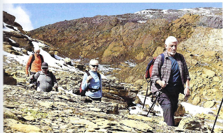
Paysage de chez nous, de La Selle aux Audannes.